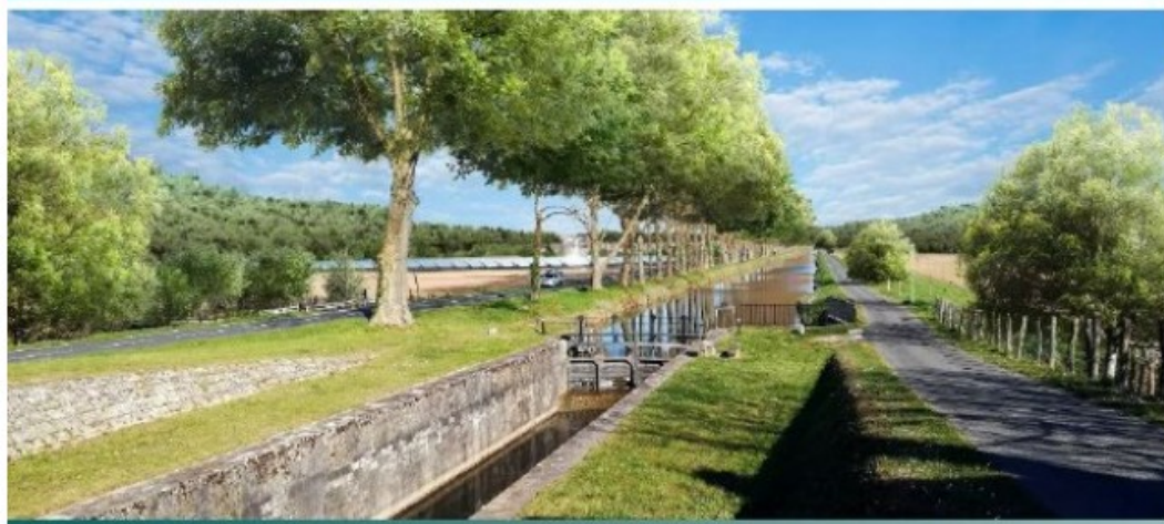
Vue 2 – Après aménagement paysager à l'est le long de l'usine POLYREY