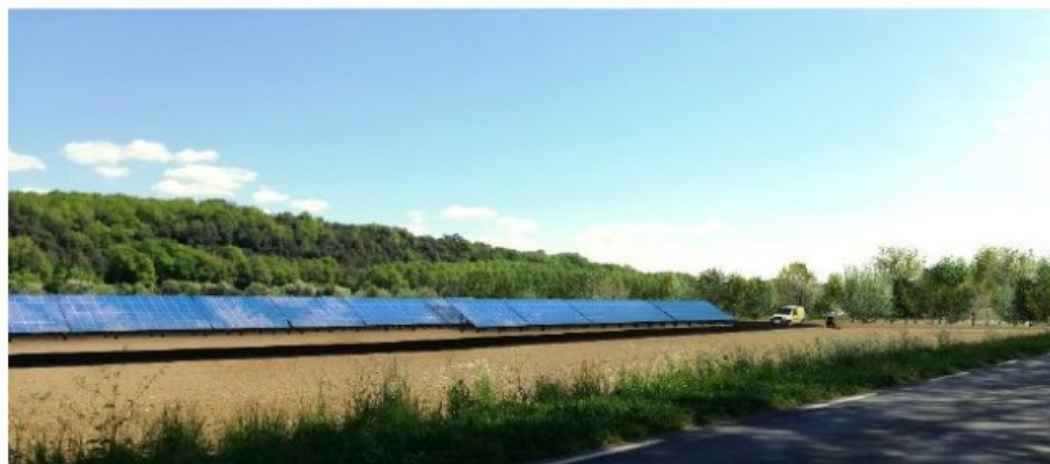
Vue 1 – Après aménagement paysager à l'est le long de l'usine POLYREY