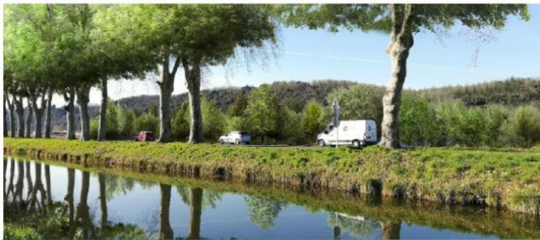
Vue 3 – Après aménagement paysager complet depuis le Canal de Lalinde

Visualisation de l'aménagement du site depuis le Canal de Lalinde (RD 660 Sens Sarlat - Bergerac)