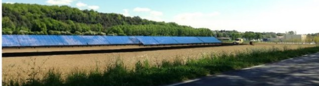
Vue 1 – Après implantation du parc photovoltaïque