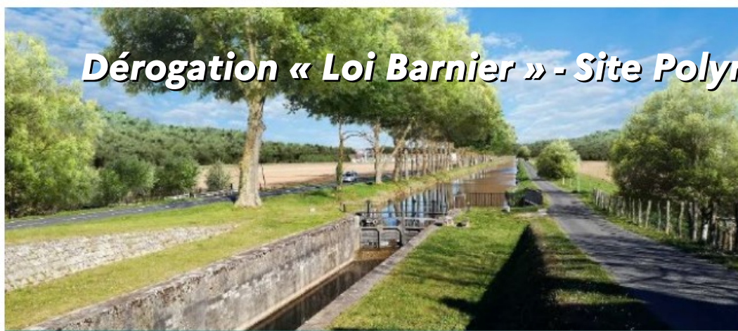
Vue 2 – Avant implantation du parc photovoltaïque