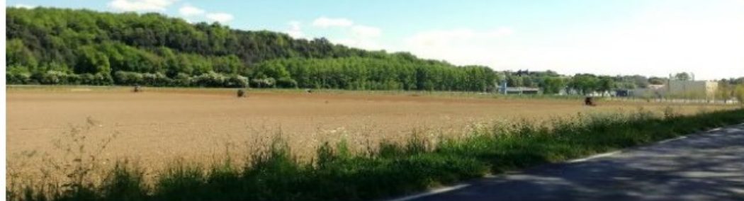
Vue 1 – Avant implantation du parc photovoltaïque