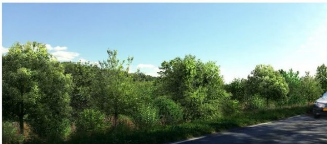
Vue 1 – Après aménagement paysager complet du site (vue façade sud)

Visualisation de l'aménagement du site depuis le route de Sarlat (façade Sud)