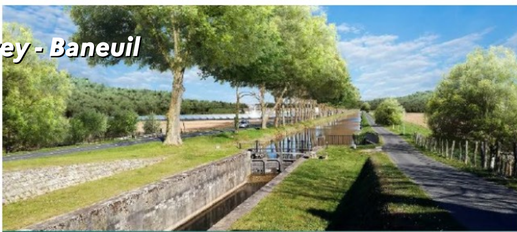
Vue 2 – Après implantation du parc photovoltaïque