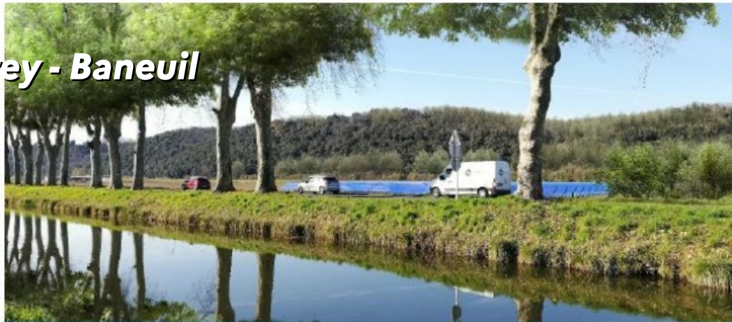
Vue 3 – Après implantation du parc photovoltaïque