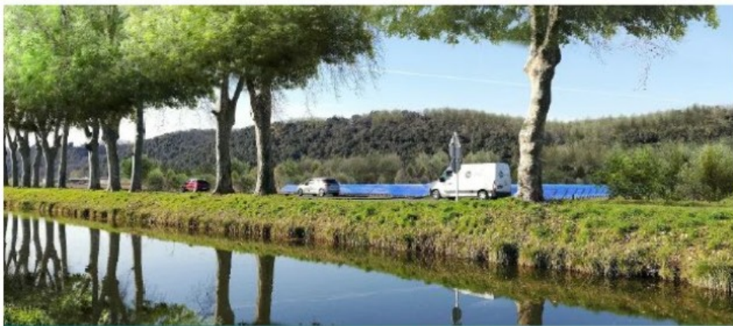
Vue 3 – Après aménagement paysager depuis le Canal de Lalinde