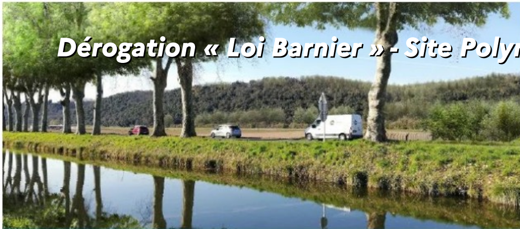
Vue 3 – Avant implantation du parc photovoltaïque