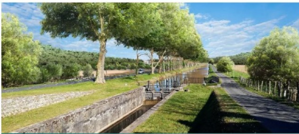
Vue 2 – Après aménagement paysager complet (vue façade sud et ouest)

Visualisation de l'aménagement du site depuis l'écluse de la Borie (Canal de Lalinde)